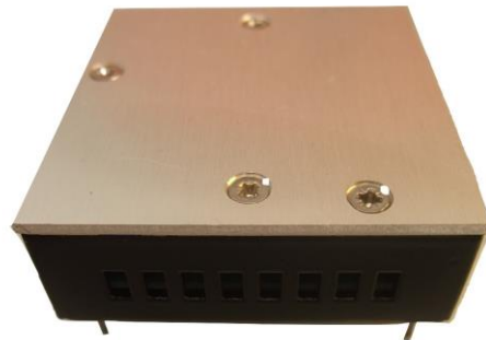
Convertisseur DC/DC : Entrée AIR2021E (12 à 60 VDC) Sortie 40 Vdc 160mA 6.5W Application Militaire embarquée Température d'utilisation -40°C à +85°C Dim : 52 x 52 x 20mm