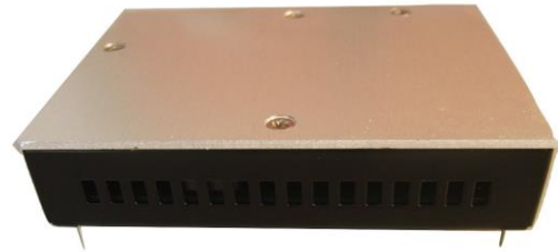
Convertisseur DC/DC : Entrée AIR2021E (12 à 60 VDC) Sortie 12 Vdc 3A 36W Application Militaire embarquée Température d'utilisation -40°C à +85°C Dim : 89 x 64 x 20 mm